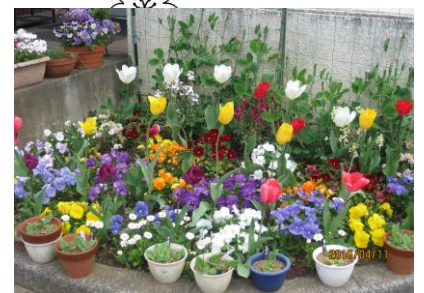
花壇を飾る草花 (玄関脇の花壇) 潤いのある環境接遇の向上