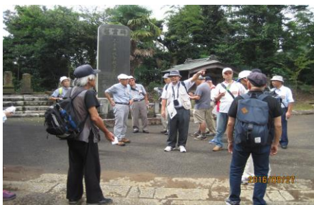
星久喜の歴史と散策 安楽寺から自噴水「太郎」、丹後堰公園へ