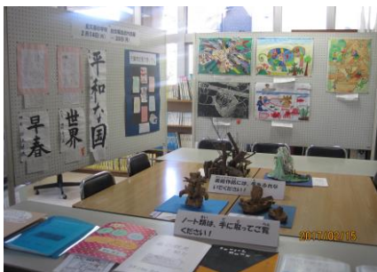
小・中学校総合展作品展示会 子どもと地域の連帯の深化