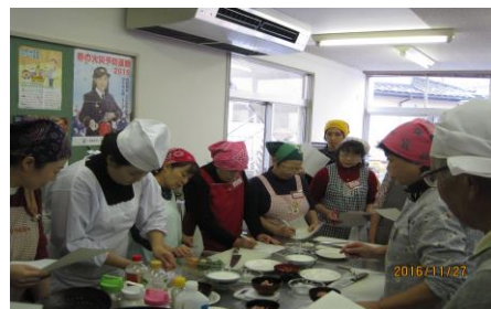
家庭で作れる おいしい中華 皆さん、とても熱心 さて、出来栄は？