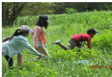
秋の虫取り (星の子ハピ・タウン) 学校教育外での多様な学習機会の提供