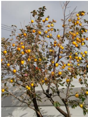
青い空に柿の実はよくはえます。

10月17日(水)には草野小学校の2年生が「まちたんけん」で公民館をたずねてくれました。いろいろなお部屋があり、本がたくさんあってびっくりしていました。サークルの活動も少し見ることができました。11月は中学生が職場体験にやってきます。