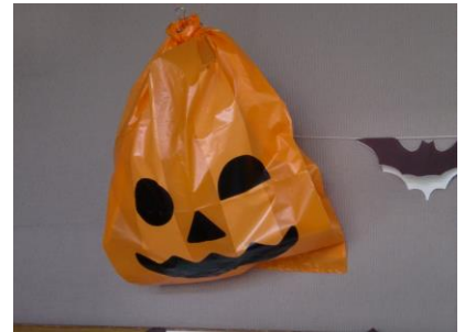
館内にはハロウィンのかざりがいっぱい。