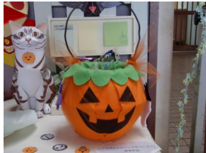
10月の講座「かぼちゃのバッグをつくろう」の参考作品