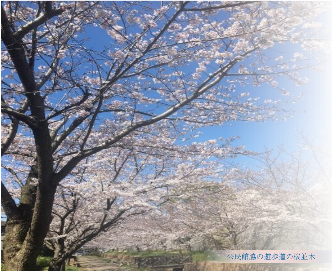
公民館脇の遊歩道の桜並木

編集・発行 千葉市おゆみ野公民館 千葉市緑区おゆみ野中央2丁目7番地6 電話 043-293-1520 FAX 043-293-1521