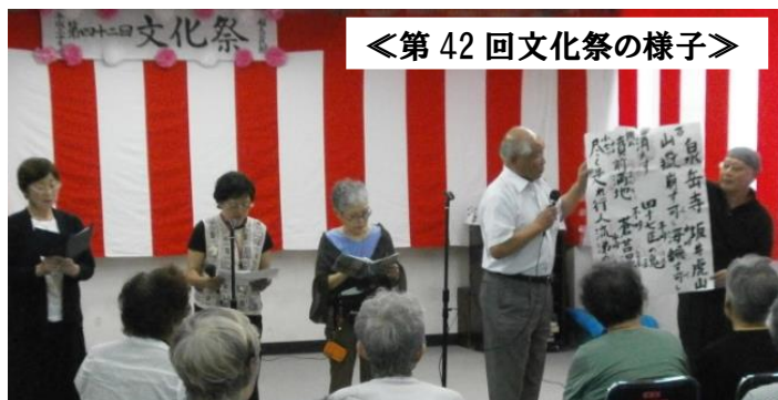
＜第42回文化祭の様子＞

本館の主催事業ですが、今年度は、文化祭を含め21の事業(35講座)を実施しました。次年度は、5事業増の計26事業を計画しております。詳細につきましては、来月号でお知らせします。