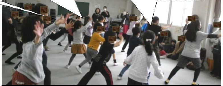
◀ キッズダンス ミニ発表会の様子 ▶

2回目の16日には、ミニ発表会が開かれました。お父さん、お母さん方の前で、微笑みながらダイナミックに踊る様子、生き生きとした姿がとても印象的でした。