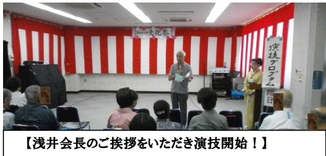
【浅井会長のご挨拶をいただき演技開始!】