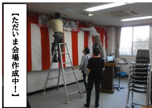
【ただいま会場作成中!】

当日は、クラブ連絡協議会加盟37団体のうち、15団体が日頃練習に励んできた演技の発表をしました。また、3団体が作品(書道・木彫り・手芸)を展示しました。「やわらぎ」等の3団体は、お饅頭や焼きそば等の店を出しました。「カフェ・ハーモニー」等、障害者施設の皆様による出店のご協力もありました。ありがとうございました。