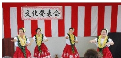
フラダンス「ブルメリアクラブ」