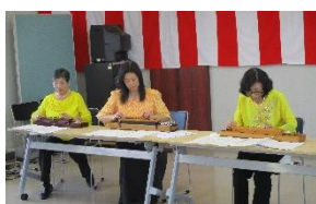
大正琴「さくらの会」