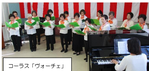
コーラス「ヴォーチェ」