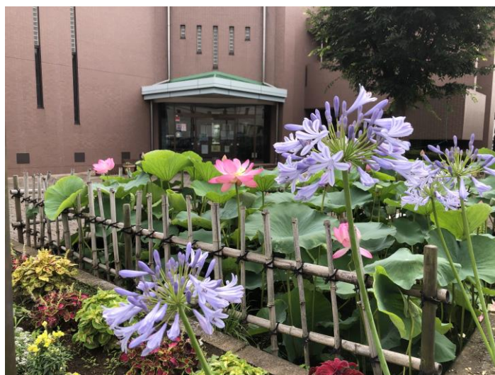
花園公民館 大賀ハス池

また、花園公民館ではいろいろなサークル活動や主催事業が活発に行われています。どうぞ、花園公民館にお越しください。大賀ハスもまだまだ咲いております！（7月下旬頃まで）