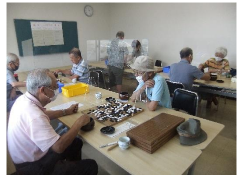
パーテーションで感染防止対策 土曜囲碁会の活動の様子

皆様に安心して公民館が利用できるようこれからも尽力していきますので、よろしくお願いします。