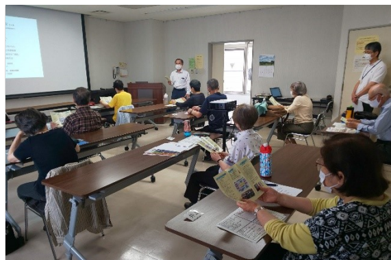
終活にはどんな備えが必要か

この講座を受講することで、これから先の人生が先細りになるのではなく、明るく楽しいものにしていただければと思いました。