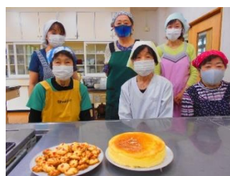
手作りお菓子とサークルメンバー