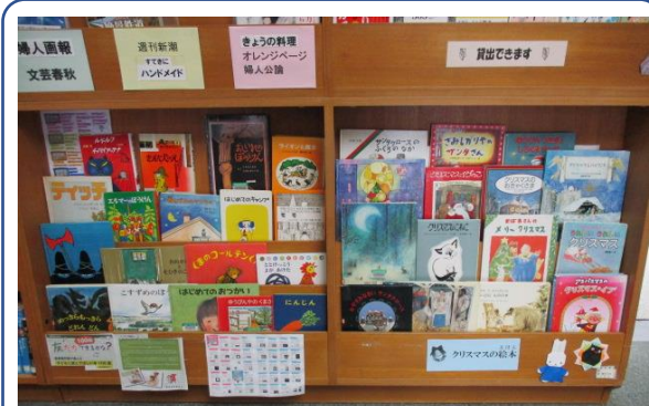
2020年クリスマス特集他の様子です。入口入って右側壁面に展開しています。

12月中旬から、大人向けは「年末年始(大掃除・おせち料理など)特集」、子ども向けは「クリスマス特集」を予定しています。季節感漂う越智公民館図書室へ、是非お越しください。