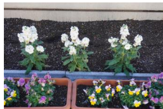
ストックとビオラ