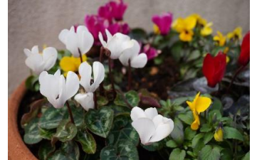
ガーデンシクラメン

今月号は3月の主催事業の案内と末広公民館の団体や個人使用の留意点や配置図について掲載されています。 主催事業等 において、ご不明な点がございましたら、公民館までお問合せくださいますようお願いいたします。