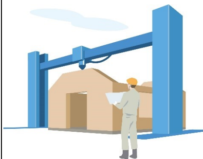
3D プリンターで作る家