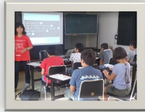
プログラミング講座 「Ichigo Jam を使って ゲームクリエイターになろう」