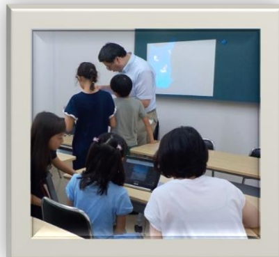
プログラミング講座 「MOON Block を体験しよう」