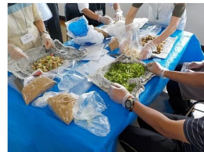
和気あいあいの中に真剣さが。

市の廃棄物対策課を通じて NPO 法人「生ごみ減量研究会」の皆様による生ごみを肥料化する講座が行われました。