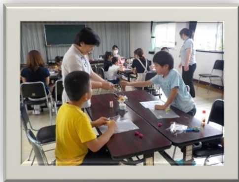
クレイクラフトで「フルーツパフェを作ろう」