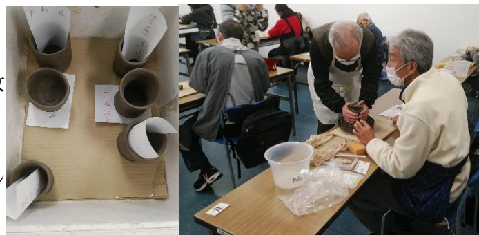
〈マンツーマン指導での作陶風景と作品〉

1月28日(木)より2コースにわかれ各全4回の「陶芸体験教室」が今年も開催されました。今年、緊急事態宣言発出中の開催となり、講座人数も絞り、三密・換気に留意しての開催となりました。そのため、講座の受講形態は、グループではなく個々となり講師を務めていただいた陶友会・千窯会の皆さんには大変ご協力をいただきました。